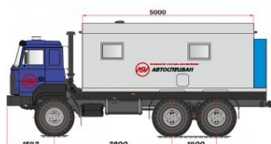
ПАРМ ASV-1 без токарного станка 6x6, фургон L=5000 мм, без токарного станка